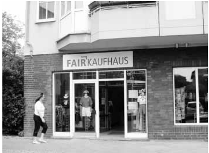
Das Fairkaufhaus in Spandau

Als ich mich für diesen Artikel in den Laden begab, war ich wieder freudig überrascht. Der Absatz an der Tür beträgt nur sieben Zentimeter, zwei Holzbretter erleichtern den Ein„tritt“ für RollifahrerInnen. Der Eingangsbereich mit Kasse ist großzügig ausgelegt, Bücher und Hüte fallen ins Auge. Bei Kinderkleidung und Schuhen hängen Tafeln mit Größenanga-