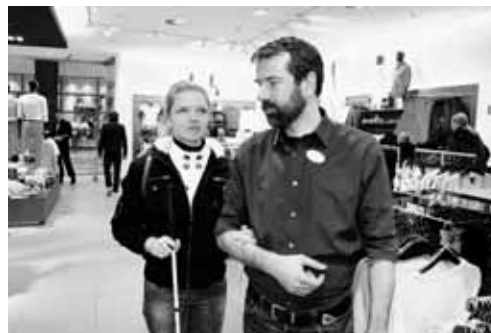
Blinde Testkäufer im ALEXA