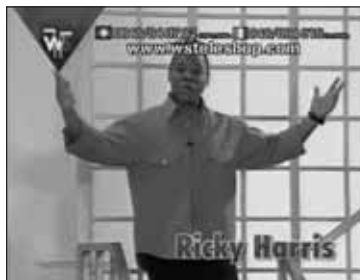
Werbepbilder von Shoppingsender