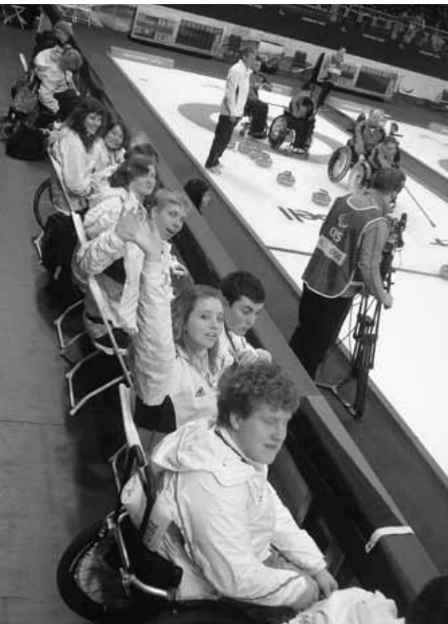
Das Team im Stadion von Vancouver