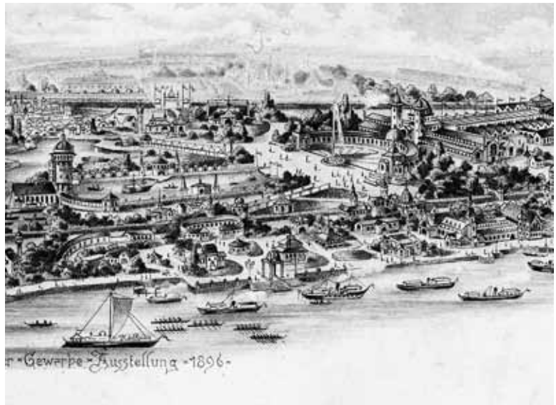
Gewerbeausstellung in Treptow 1886

Im Grundriss des heutigen Russischen Ehrenmals und seines Vorplatzes findet man den Standort des künstlichen Sees wieder. Auf dem See konnten die Zuschauer damals Modelle der kaiserlichen Marineflotte bei Vorführungen begutachten – mit echtem Feuer und Pulverdampf.