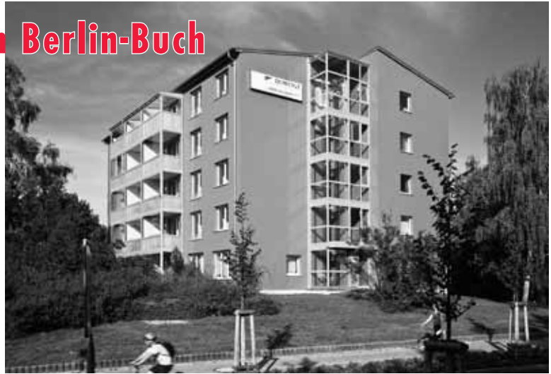
Barrierefreie Wohnungen der HOWOGE in der Robert-Rösle-Str. 1

Auch bei den vor zehn Jahren erfolgten Wohnungsmodernisierungen der GESO-BAU, seit 2009 durch die HOWOGE erfolgten Wohnungsmodernisierungen, wurden die Belange Behinderter berücksichtigt. So sind die Balkone nunmehr ohne Hindernisse mit dem Rollstuhl erreichbar. Auf Wunsch wurden Duschen zur Unterfahrbarekeit mit Fußbodenentwässerung ausgestattet. Vorbildlich verhielt sich hierbei die EWG Pankow, die in den sanierten zehngeschossigen Wohnhäusern die Wohnungsgrundrisse nach den Vorstellungen der zukünftigen Mieter individuell gestalten ließ. So konnten und kön-