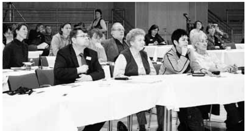
Tagung im Hotel HausRheinsberg